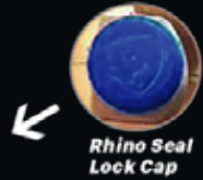
Rhino Seal Lock Cap